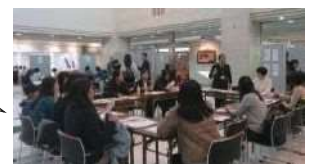
好評だった昨年の様子

育児をしながら就活をしています。 今回キャリア・カフェに参加したことで 頭が整理されて、すっきりしました!